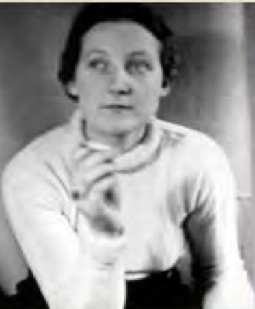
Cato Bontjes van Beek, um 1939

weitete ihren Blick auf die Welt und blieb doch das Mädchen aus Fischerhude. Sie war eine Tänzerin im Sturm, selbstbewusst emotional, dabei klar denkend und handelnd, voller Leidenschaft und Freiheitsliebe.