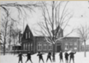
Die alte Schule 1930, heute Kita