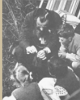
Mit Theodor Lessing auf Naturentdeckung, 1930