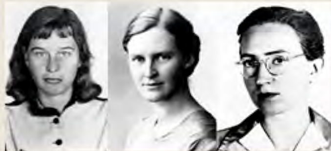
Als Mitglieder der „Roten Kapelle“ wie Cato Bontjes van Beek in Berlin-Plötzensee ermordet: Libertas Schulze-Boysen †22.12.1942, Mildred Harnack †16.2.1943, Hilde Coppi †5.8.1943

Ab 1939 formierte sich der Widerstand gegen den Nationalsozialismus in einigen locker vernetzten Gruppen, gegen die die Gestapo unter dem Sammelnamen „Rote Kapelle“ ermittelte. Ihre etwa 150 Mitglieder, darunter viele Frauen, kamen aus Beamtschaft und Wehrmacht, Arbeiterkreisen und Kirchen, waren Künstlerinnen und Künstler oder politisch Aktive verschiedener sozialistischer Richtungen. Sie einte die Gegnerschaft zum Hitler-Regime und die Abscheu vor den Verbrechen der Nazis. Der Kreis um Mildred und Arvid Harnack, Libertas und Harro Schulze-Boysen sowie Hilde und Hans Coppi verfasste illegale Schriften, verteilte Flugblätter, verbreitete Predigten des Münsteraner Bischofs von Galen und veröffentlichte Texte gegen den Krieg.