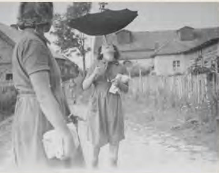
Beim Reichsarbeitsdienst in Ostpreußen, 1940

Wenn ich es nicht werden will und dafür Schiethustapeziererin bevorzuge, so werde ich es auch. Ich will mich erst einmal hier in Berlin umsehen, und alles Weitere wird sich dann schon finden.“ Als freiheitsliebende, dem Leben zugewandte Menschen teilten die beiden Schwestern miteinander die tief empfundene Ablehnung des Nationalsozialismus. Gemeinsam organisierten sie ab 1940 in Berlin Hilfe für französische Kriegsgefangene, ukrainische Zwangsarbeiterinnen und verfolgte Juden.